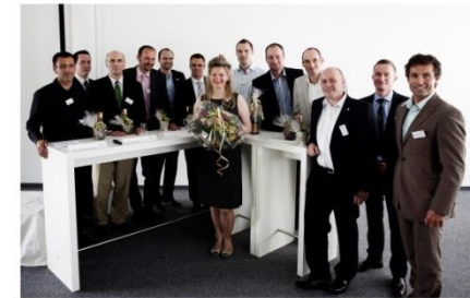
Schriftenreihe des internationalen Hochschulverbands IUNworld