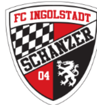
FC Ingolstadt 04